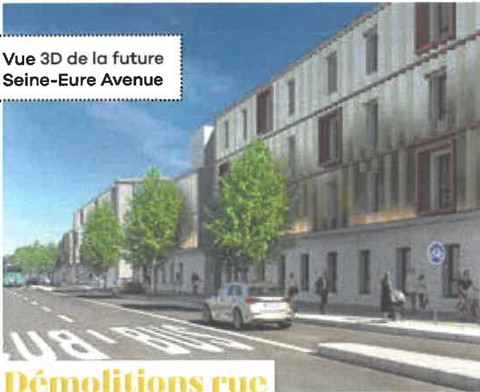
Vue 3D de la future Seine-Eure Avenue

L'Agglo Seine-Eure construit et aménage des équipements structurants pour le territoire.